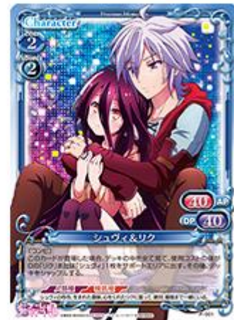
『ノーゲーム・ノーライフゼロ』非売品カードスリーブ 確定SRカード1枚 20枚